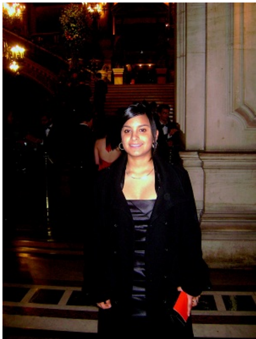
Kelly au gala de l'Opéra à l'occasion du Bal de l'X 2013